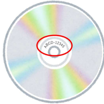
図：規格品番の記載例（ABCD- 12345が規格品番）

レコード会社によって出版されたCDの音源を利用する場合は規格品番（別名：商品番号、レコード番号、カタログ番号等）を、市販のCDよりコピー・ダビングされた楽曲の場合は録音許諾番号を提出すること。ただし、中古のCDは使用可能であるが、レンタル用CDは使用不可である。規格品番の番号が記載されている場所の例を以下の図に示す。